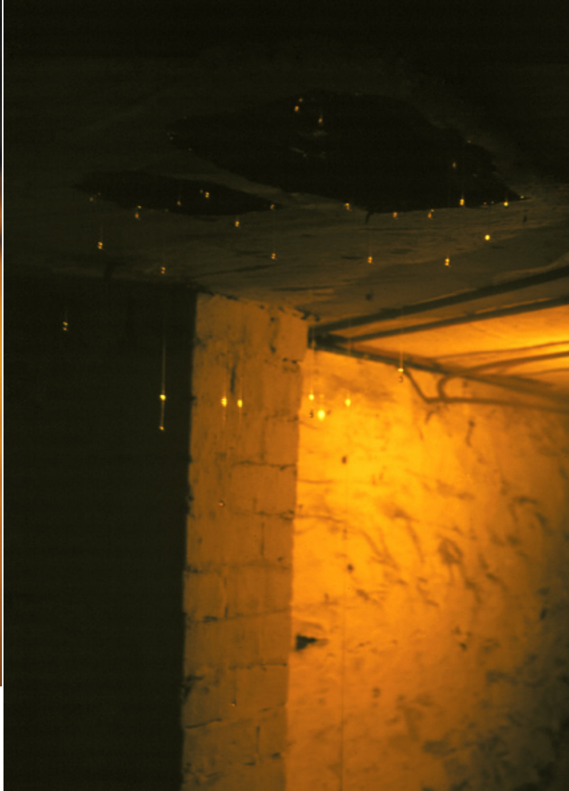
cave, 2002 colle termofusibile, Sheffield, England