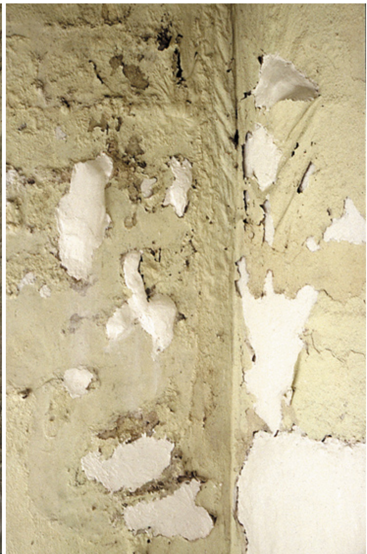
toilettes , 2002 plâtre, peinture, Sheffield, England