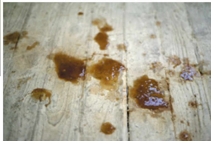
plafond , 2002 colle à tapisserie, thé, Lyon