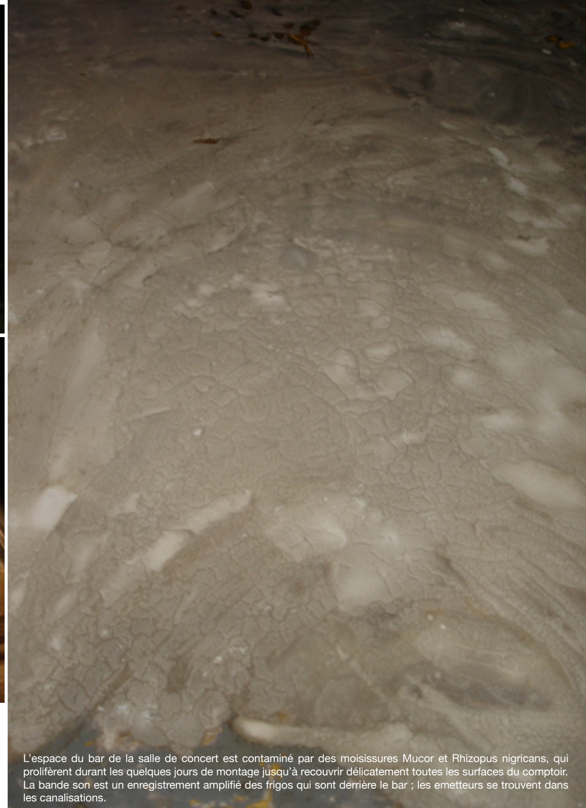
buvette , le 4 décembre 2005 gélose, moisissures, installation sonore, CCO de Villeurbanne exposition «Veuillez patienter...», proposition du FLAC en résonance de la biennale d'art contemporain

L'espace du bar de la salle de concert est contaminé par des moisissures Mucor et Rhizopus nigricans , qui prolifèrent durant les quelques jours de montage jusqu'à recouvrir délicatement toutes les surfaces du comptoir. La bande son est un enregistrement amplifié des frigos qui sont derrière le bar ; les émetteurs se trouvent dans les canalisations.