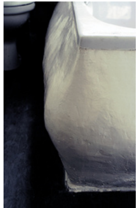
baignoire , 2002 plâtre, peinture, Sheffield, England