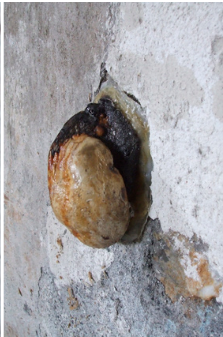
polypores , 2007 2 polypores, latex, papier, colle, Samoëns