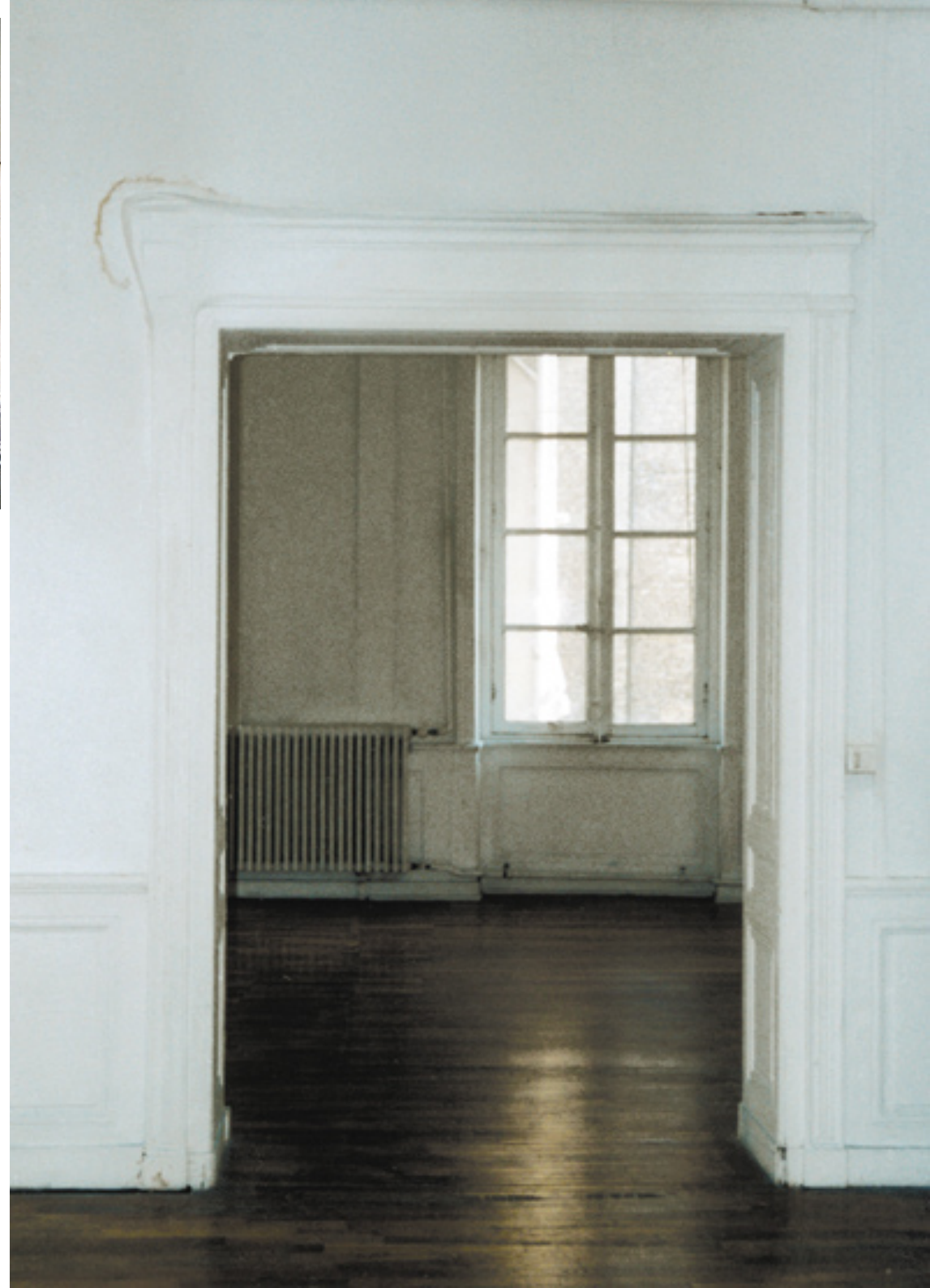
chambranle , 2001 plâtre, peinture, Lyon