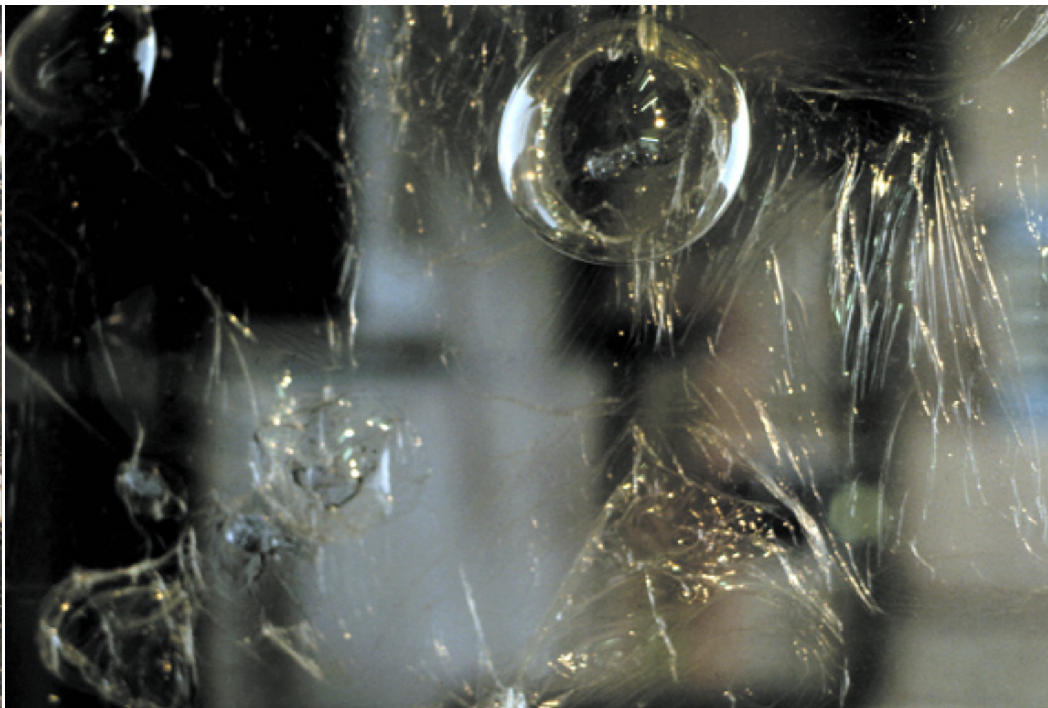
vitre , 2002 pâte à ballon, Sheffield, England