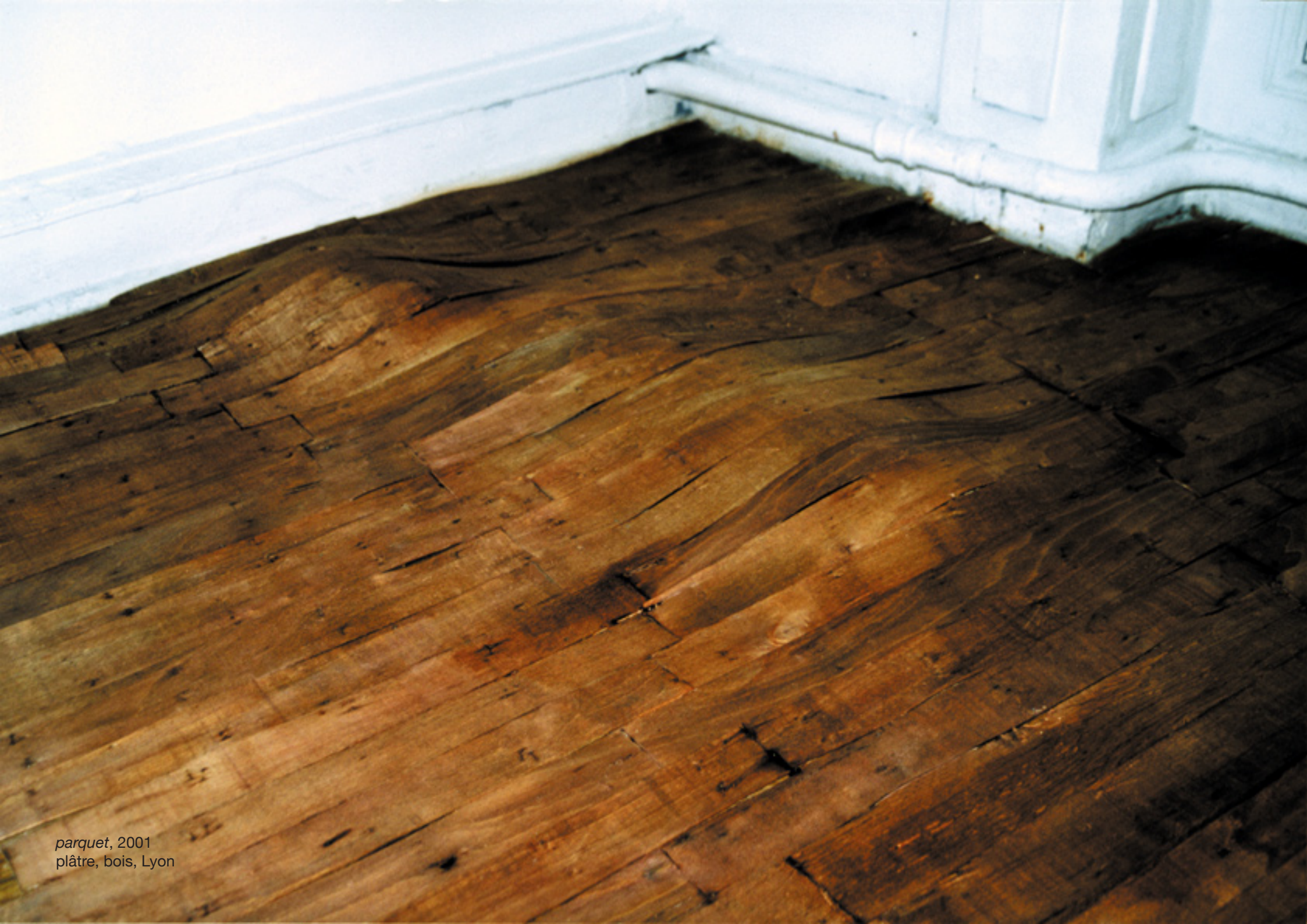
parquet, 2001 plâtre, bois, Lyon