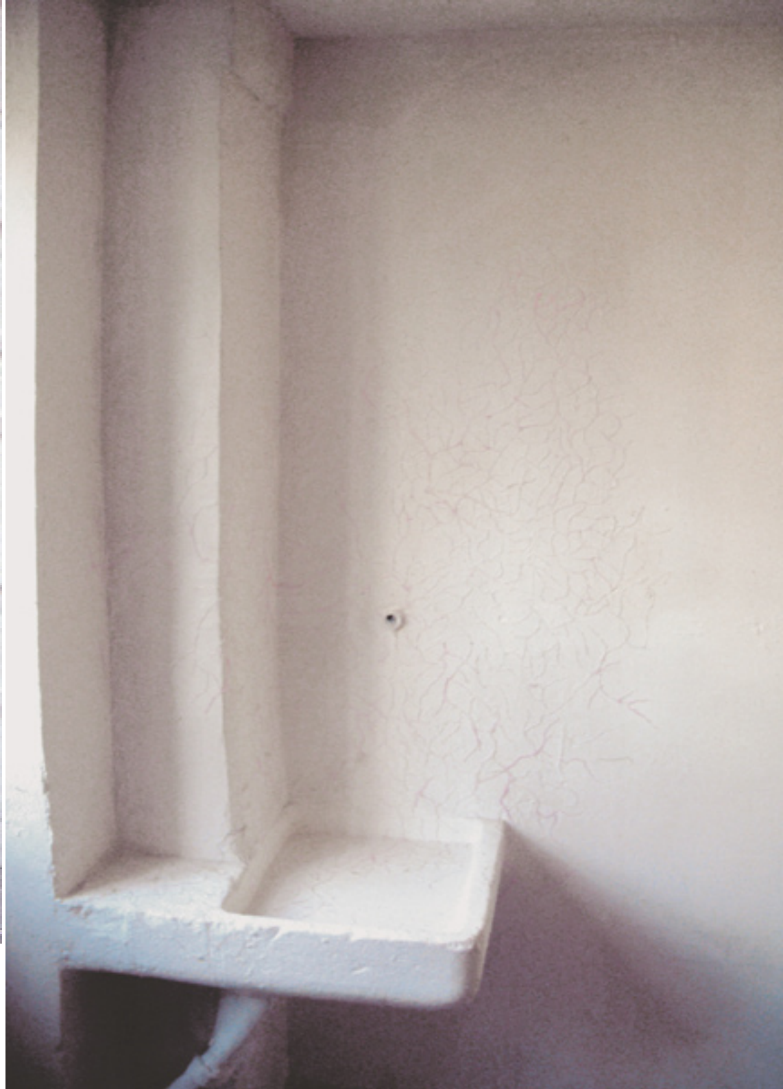
réseau , 2003 colle thermofusible blanche et rose, Lyon