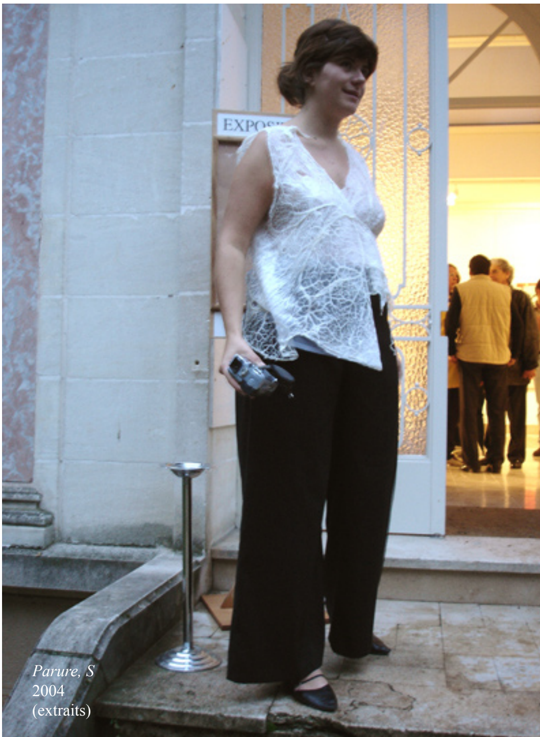
Parure, S 2004 (extraits)

-alors je suis venu il y a 3/4 jours, et je reviens ce soir pour le vernissage, c'est super, super. Je voulais vous féliciter. C'est un travail extraordinaire, c'est de toute beauté