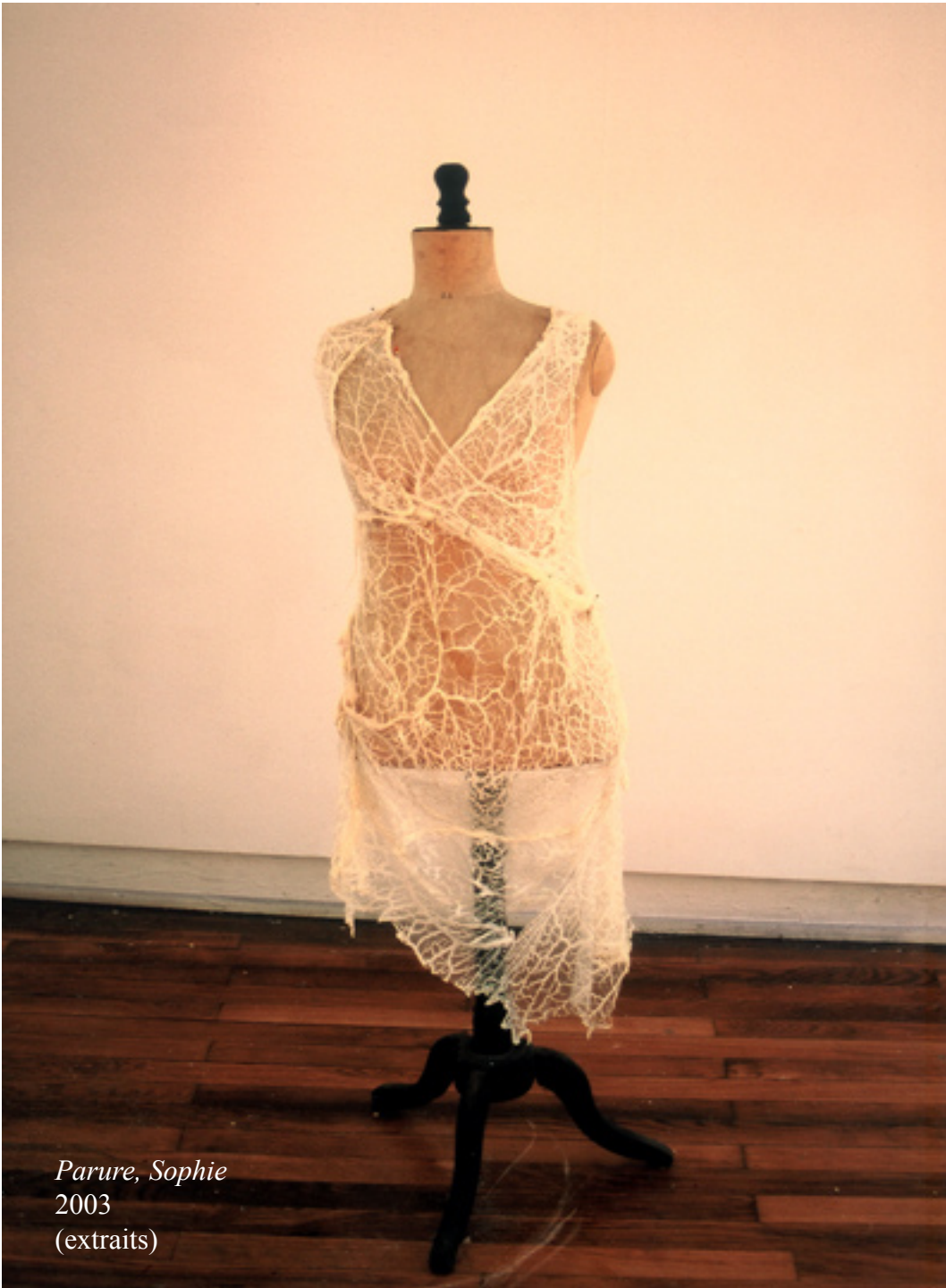
Parure, Sophie 2003 (extraits)