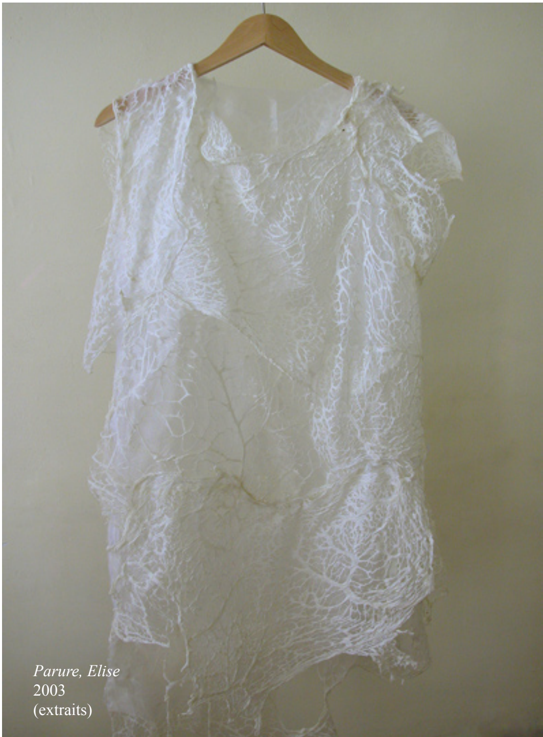
Parure, Elise 2003 (extraits)