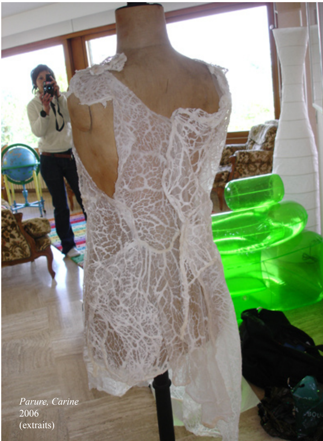
Parure, Carine 2006 (extraits)